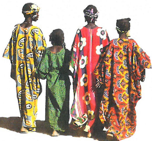
J.-C. Le Billan

Communiqué de presse à l'issue de la rencontre entre la délégation des évêques français et les évêques de la région des Grands Lacs, Kinshasa, le 7 juillet 2004.